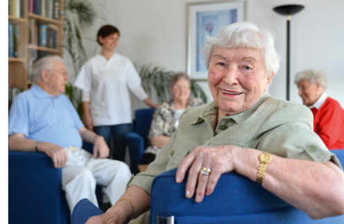
Treffen in der Bibliothek des Franz-Göhler Seniorenstifts – eine der ersten Adressen für betreutes Wohnen.