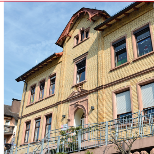
Zentrale der Caritas-Sozialstation in der Brunnenstraße in Hösbach.

Wir werden auch in den kommenden Jahren unseren hohen Qualitätsstandard halten und stetig an die neuen Herausforderungen anpassen. Schon heute freuen wir uns auf unsere Patienten von morgen.